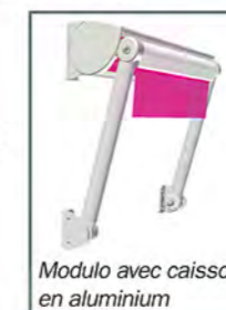
Modulo avec caisson en aluminium

Élégance, simplicité et discrétion : le store Modulo protège vos fenêtres. Il procure une fraîcheur naturelle et tamise la lumière extérieure pour vous procurer un excellent confort visuel intérieur. Une fois refermé, il pourra disparaître dans son coffre de protection en aluminium (optionnel). Quant aux manœuvres, vous avez le choix entre un cordon, une manivelle ou la motorisation.