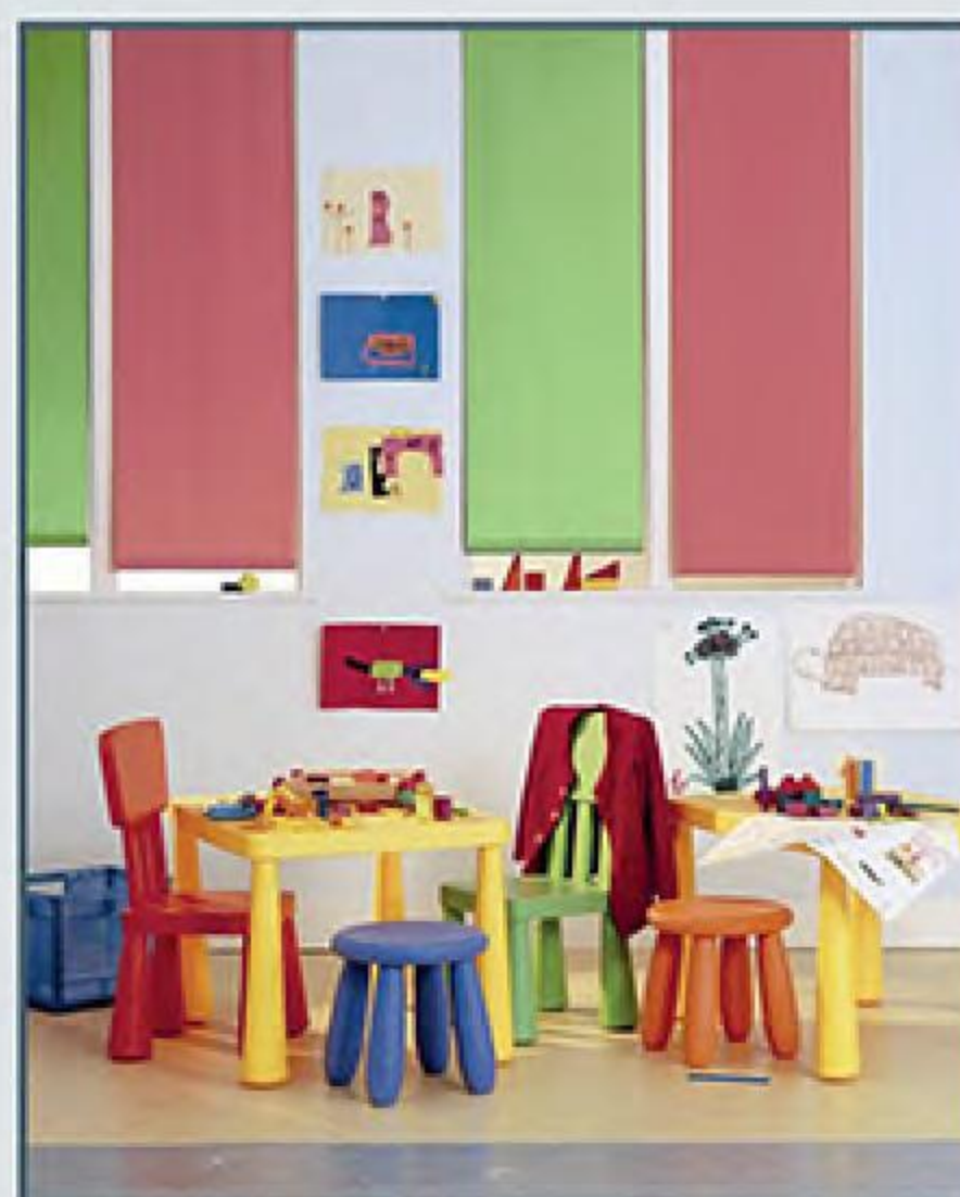
Gamme complète de stores intérieurs : vénitiens, bandes verticales, rouleaux ...

1 er volet roulant rénovation électrique à projection entièrement automatisé qui permet de jouer sur la hauteur du tablier pour moduler l'entrée d'air et de lumière.